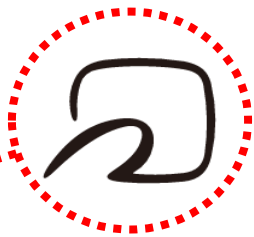
このマークの部分