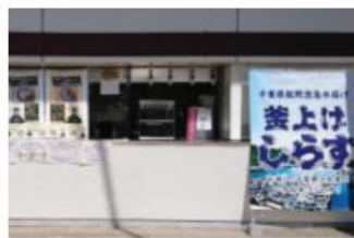
【南常設：湾岸ケータリ